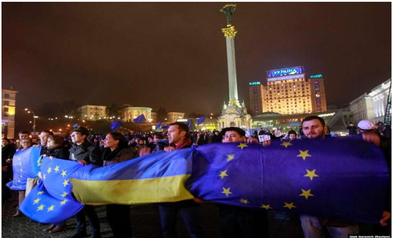
Мітинг на майдані Незалежності 21 листопада 2013 року на підтримку підписання Угоди про асоціацію з ЄС.

У ніч на 22 та вдень 22 листопада протестні акції розпочалися у Харкові, Хмельницькому, Житомирі, Миколаєві, Одесі, Рівному, Кіровограді, Сумах, Луганську, Чернівцях, Черкасах, Чернігові.