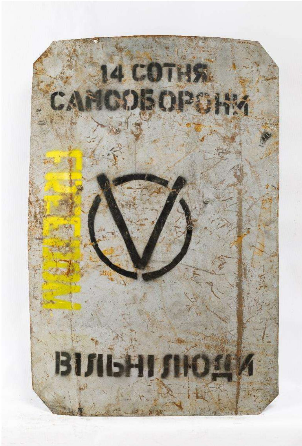
Щит члена 14-ї сотні Самооборони Майдану.

звільнити від протестувальників майданчик поблизу будівлі палацу, відкривши вогонь на ураження.