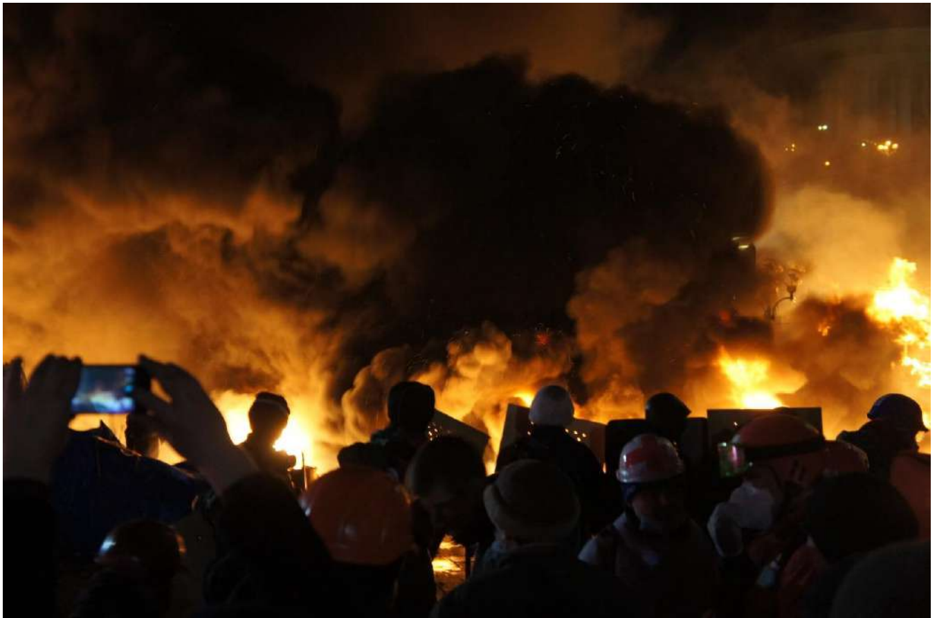
Оборона Майдану. Ніч проти 19 лютого 2014 року.

Того самого дня голова СБУ Олександр Якименко оголосив про початок проведення «антитерористичної операції», звинувативши учасників акцій протесту у вандалізмі, мародерстві, вбивствах, захопленні держустанов та зброї. Однак цю заяву було засуджено не лише лідерами демократичного світу та опозиційними політиками, а й деякими поплічниками Януковича. Ближче до вечора СБУ спростувала інформацію про початок антитерористичної операції. Почалися переговори лідерів опозиції з В. Януковичем, після яких було оголошено перемир'я.