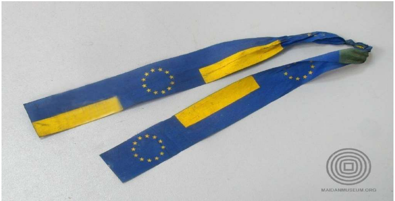
Стрічка із символікою Євросоюзу та кольорами прапора України.

Під час сутичок із силовиками – спочатку на вулиці Михайла Грушевського, а потім і на самому майдані Незалежності – символами активних протестів стали пляшки з «коктейлем Молотова», бруківка та шини , підпалюючи які протестувальники створювали вогняний кордон і димову завісу, що закривала їх від бійців МВС.