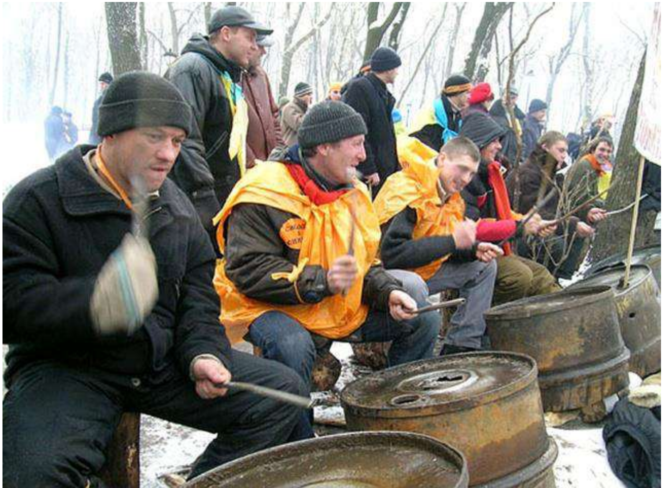
Барабанщики Помаранчевої революції.

Оригінальним виявом творчого духу Майдану стали «барабанщики революції» – група людей, які навпроти будівлі Кабінету Міністрів України стукали в металеві бочки, що залишилися в Маріїнському парку після мітингів прихильників Януковича.