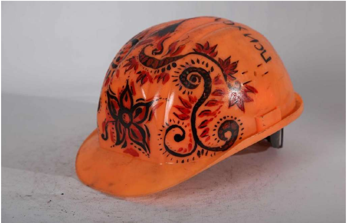
Каска волонтера психологічної служби Майдану. Із фондів НМРГ

Символом Майдану стала конструкція новорічної ялинки, встановлена на головній площі столиці. Майданівці називали її « йолкою ». Ставши формальною причиною побиття людей у ніч на 30 листопада 2013 року, згодом вона перетворилася на один із головних символів протесту. Мітингарі прикрасили її прапорами, плакатами, банерами тощо.