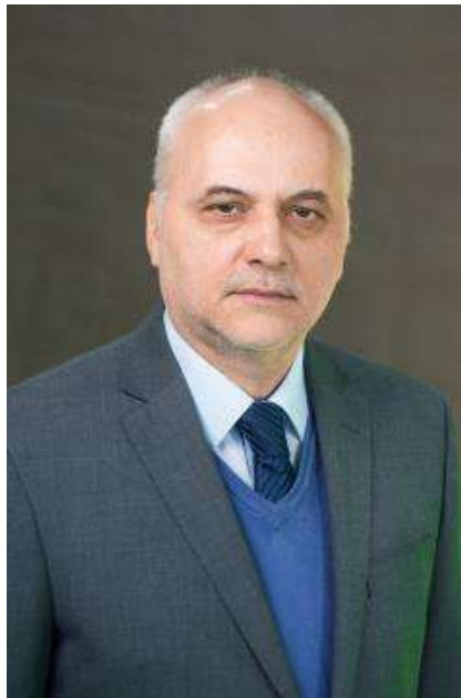
Марек Мельник, релігієзнавець, професор Вармінсько-Мазурського університету (Ольштин, Польща).

Певний час після Євромайдану західний світ тримався осторонь подій, які відбувалися в Україні. Лише російсько-українська війна в її гострій фазі, що почалася 24 лютого 2022 року, й передусім отой спротив, який чинять не тільки українські військовики, а й цивільне населення, змусили демократичні суспільства та уряди усвідомити важливість України для майбутнього Європи.