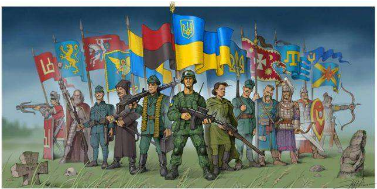
Малюнок Юрія Журавля.