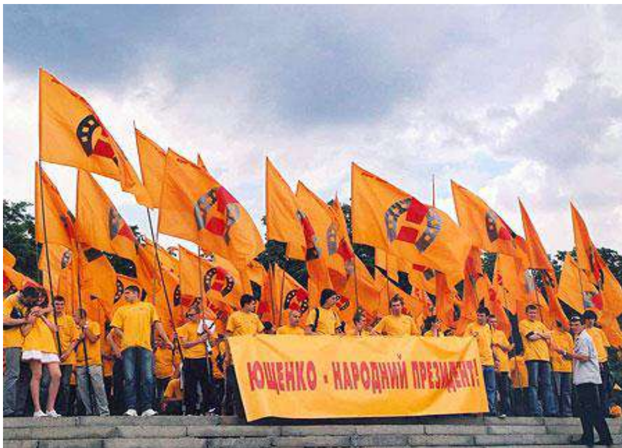
Учасники передвиборчої кампанії на підтримку кандидата в президенти Віктора Ющенка.