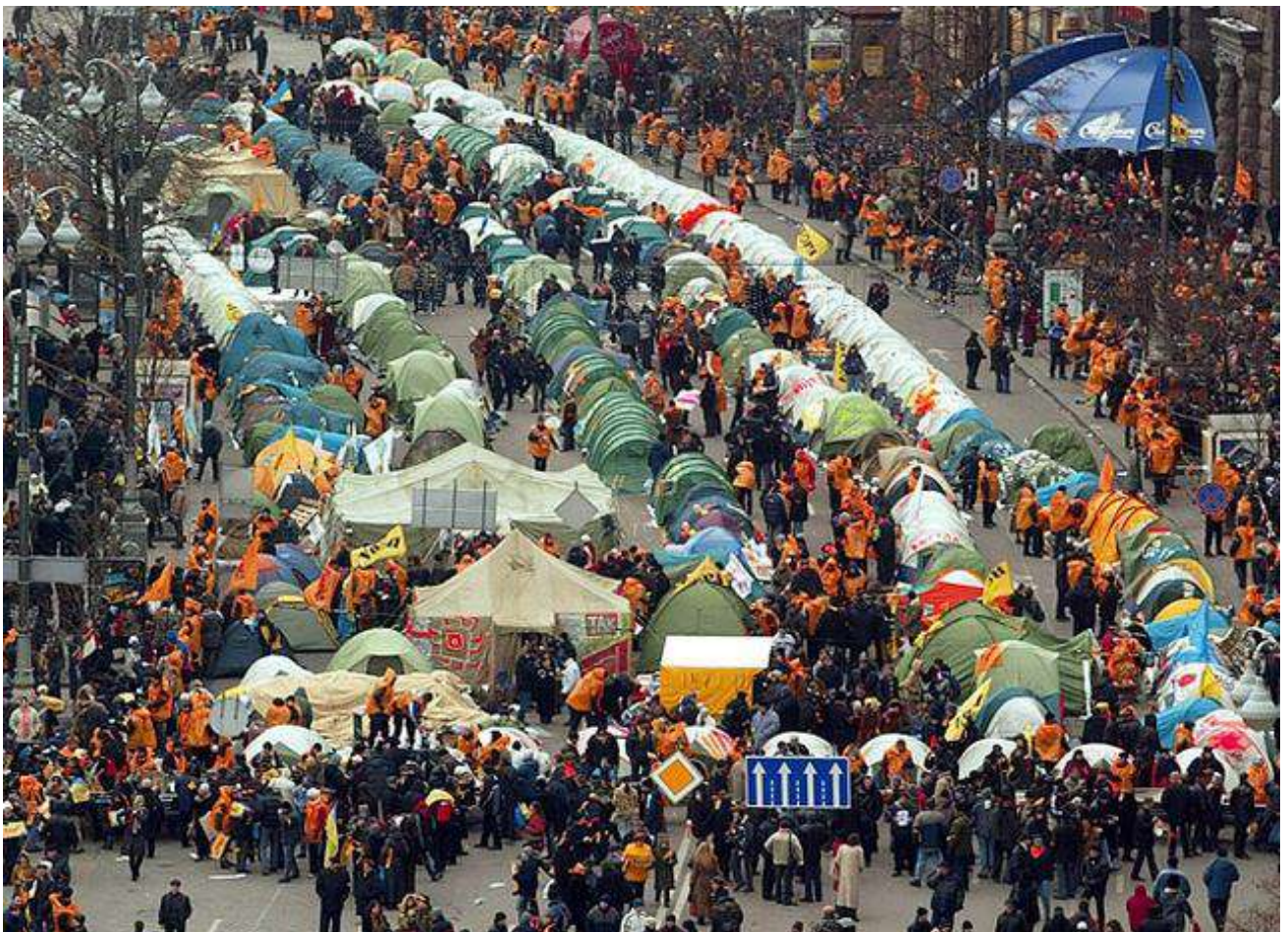
Наметове містечко у середмісті Києва.

22 листопада о 4-й годині ранку протестувальники почали встановлювати намети. Протягом наступної доби наметове містечко розрослося приблизно до 400 наметів, розміщених по всьому Хрещатику аж до Бессарабської площі. Навколо містечка встановили огорожу. Штаб Віктора Ющенка організував пряму супутникову трансляцію з Майдану, чим одразу скористалися провідні світові телеканали. Панорама київського Майдану потрапила в поле зору багатьох країн світу.