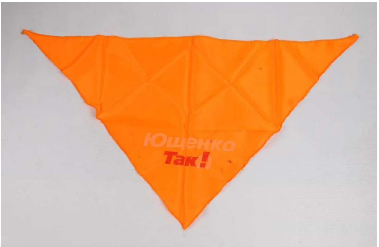
Хустина учасника Помаранчевої революції.

Окрім стрічок, з інших атрибутів помаранчевого Майдану використовували помаранчеві прапори з логотипом партії «Наша Україна» у вигляді підкови зі знаком оклику й написом «Так», наліпки, плакати, а також елементи одягу помаранчевого кольору: накидки (дощовики), хустки, шарфи тощо.