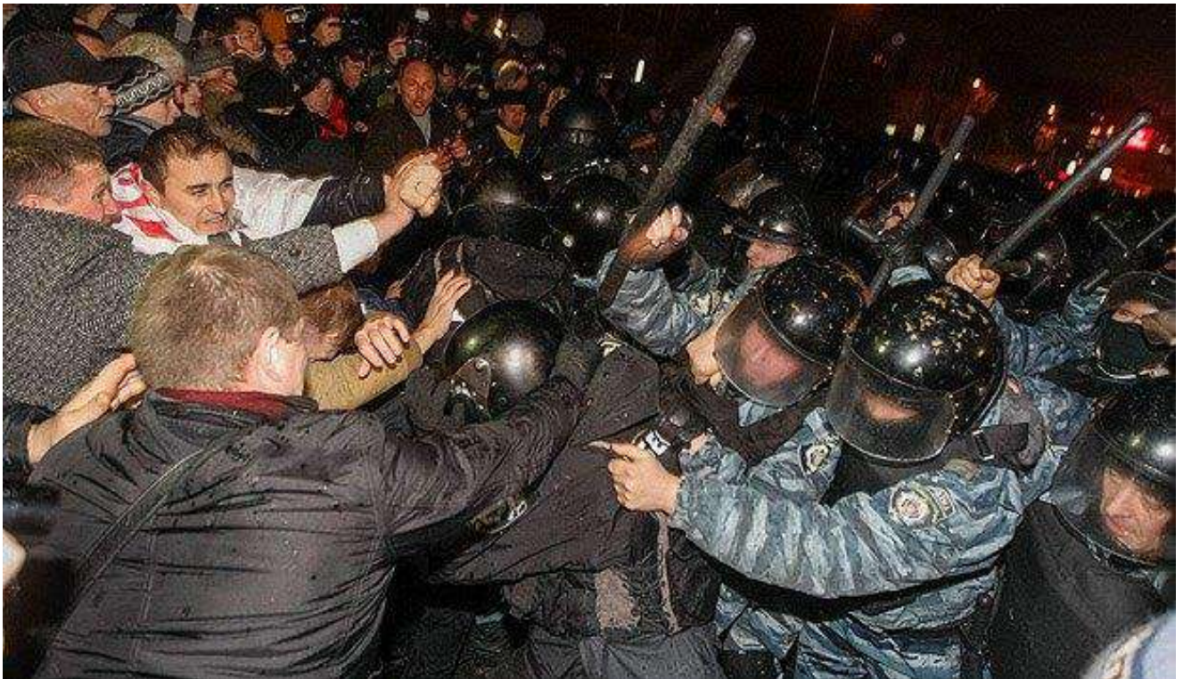
Побиття мітингувальників біля монумента Незалежності у ніч на 30 листопада 2013 року.

Офіційною причиною розгону Євромайдану назвали підготовчі роботи з установлення традиційної новорічної ялинки в центрі Києва.