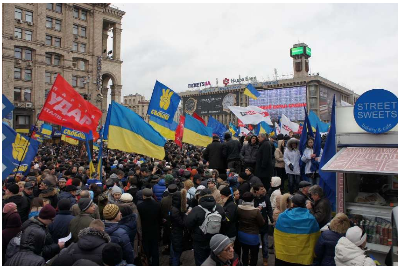
* Мітинг на майдані Незалежності 1 грудня 2013 року.

На вулиці Банковій неподалік від Адміністрації президента відбулися сутички між мітингарями та «Беркутом», під час яких потерпіли зокрема українські та іноземні журналісти.